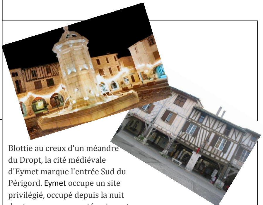
Blottie au creux d'un méandre du Dropt, la cité médiévale d'Eymet marque l'entrée Sud du Périgord. Eymet occupe un site privilégié, occupé depuis la nuit des temps comme en témoignent d'importants vestiges.