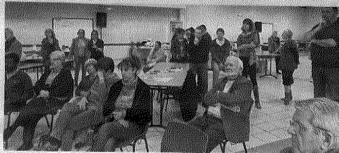
Le public se rassemble pour écouter les lectures théâtralisées.

Et puis, après un repas partagé dans la gaîté, les visiteurs affluent en début d'après-midi. Les